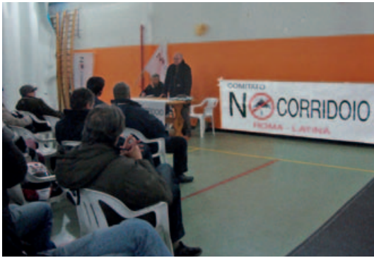
L'incontro a Spinaceto

Mercoledì 29 gennaio, Spinaceto, si incontra il comitato no-corridoio Roma-Latina, sempre più attivo nel sensibilizzare la popolazione contro il progetto dell'autostrada a pedaggio. Gli incontri raccolgono sempre più persone in questa fase che sembra non lasciare più tanto tempo a disposizione. Il 3 marzo scadono i termini per la presentazione del ricorso, che sta preparando l'associazione Verdi, Ambiente e società (VAS) e che darà l'incarico al pool di avvocati dell'associazione «giuristi democratici».